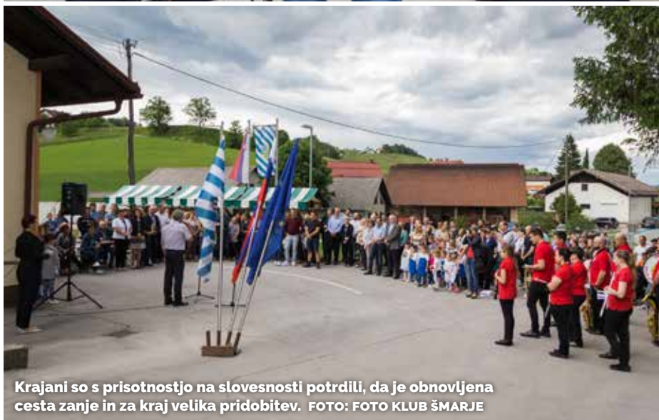
Krajani so s prisotnostjo na slovesnosti potrdili, da je obnovljena cesta zanje in za kraj velika pridobitev.