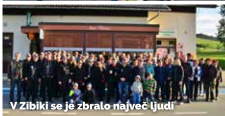
V Zibiki se je zbralo največ ljudi