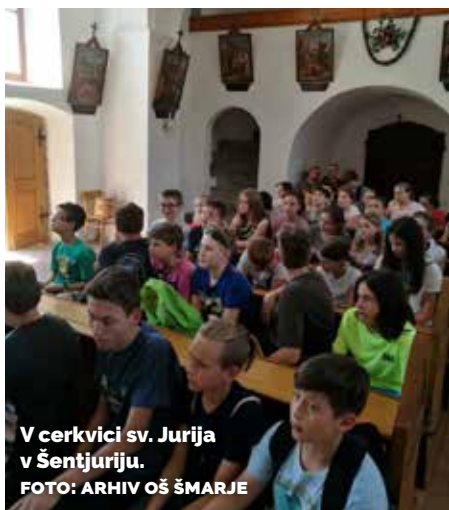
V cerkvi sv. Jurija v Šentjuriju.