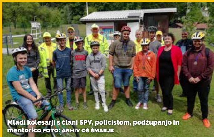
Mladi kolesarji s člani SPV, policistom, podžupanjo in mentorico