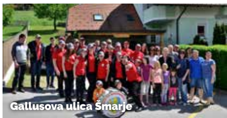
Gallusova ulica Šmarje