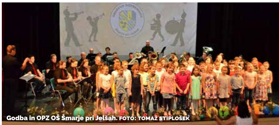
Godba in OPZ OŠ Šmarje pri Jelšah.