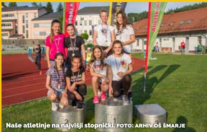
Naše atletinje na najvišji stopnički.

Atletika je kraljica športov. No, vsaj tako pravijo. Tega se zavedamo tudi na OŠ Šmarje pri Jelšah, zato smo se v petek, 11. 5. 2018, udeležili medobčinskega tekmovanja v atletiki za VAP (veliki atletski pokal) in MAP (mali atletski pokal), ki se že nekaj let odvija v Šentjurju. Poleg OŠ Šmarje pri Jelšah so sodelovale tudi I. OŠ Rogaška Slatina, II. OŠ Rogaška Slatina, OŠ Bistrica ob Sotli, OŠ Kozje, OŠ Podčetrtek, OŠ Rogatec in OŠ Lesično.